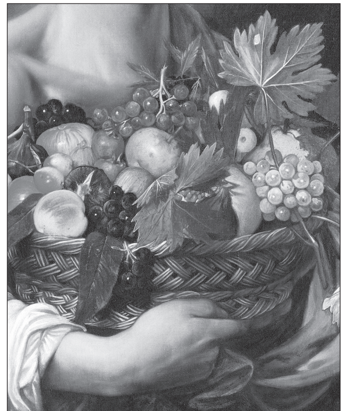
La obra del pintor italiano Michelangelo Merisi da Caravaggio ofrece elementos históricos.

Presea Savia del Edén otorgada por el Festival Cultural CEIBA Tabasco 2005.